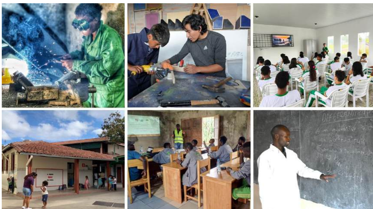
Scuole partner a Nairobi, Quito, Manaus, Belo Horizonte, Yaoundè, Marinwa (Kenya)