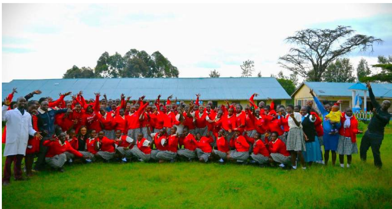
Scuola secondaria femminile Our Lady of Angels a Marinwa, nella contea rurale di Narok (Kenya)-partner del progetto W4GER