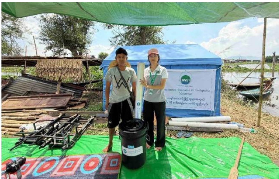
Distribuzione di teli di plastica e materiali WASH al villaggio di Kay Lar

Le testimonianze raccolte mostrano come un aiuto rapido abbia offerto protezione e continuità di vita in un contesto segnato da conflitti, povertà e instabilità.