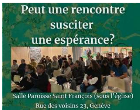
Incontro a Ginevra

I costi di struttura hanno rappresentato il 12%.