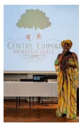
Momenti del maggio solidale