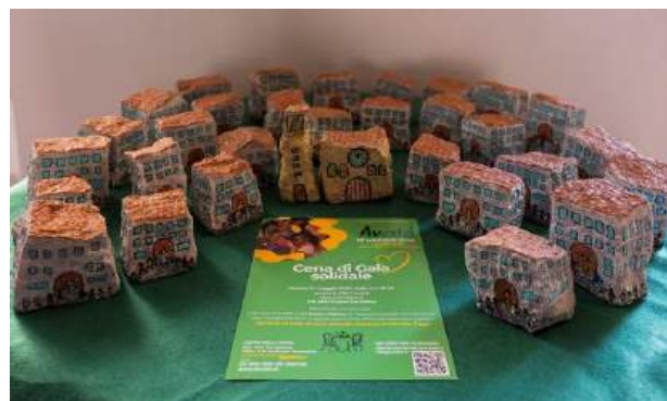
Artigianato - Cena di Gala Solidale, Loverciano